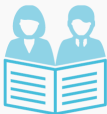
CONSEIL & GESTION DE PROJETS