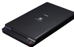
DIN A4-Flachbett-Scaneinheit 102

Scannen Sie Bücher, Zeitschriften und empfindliche Medien mit der optionalen Flachbett-Scaneinheit 102 (bis DIN A4) oder der Flachbett-Scaneinheit 201 (bis DIN A3). Einfach per USB angeschlossen, arbeiten diese Flachbettscanner nahtlos mit dem DR-C225 II (ausschließlich) zusammen und ermöglichen die Anwendung aller verfügbaren Funktionen zur Bildverbesserung.