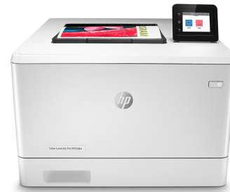
HP Color LaserJet Pro M454dw

Imprimante avec sécurité dynamique activée. Uniquement destinée à être utilisée avec des cartouches dotées d'une puce authentique HP. Les cartouches dotées d'une puce non HP peuvent ne pas fonctionner et celles qui fonctionnent actuellement pourraient ne plus fonctionner à l'avenir. Pour en savoir plus, consultez :