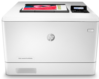
HP Color LaserJet Pro M454dn

Le secret de la réussite d'une entreprise : travailler intelligemment. L'imprimante HP Color LaserJet Pro M454 est conçue pour vous laisser vous consacrer aux tâches assurant la croissance efficace de votre entreprise et vous permettant de rester en tête de la concurrence.