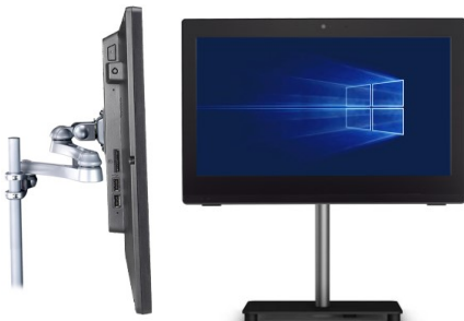
Bild rechts: Das Gerät lässt sich dann immer noch mit Hilfe einer aufgeklappten Büroklammer einschalten, die man durch ein unscheinbares Loch an der Geräteseite drückt.

Bild links: Der Einschalt-Button lässt sich deaktivieren, um unbefugtes Betätigen zu unterbinden. Hierzu öffnen Sie den PC und ziehen den entsprechenden Anschluss heraus (siehe Markierung).